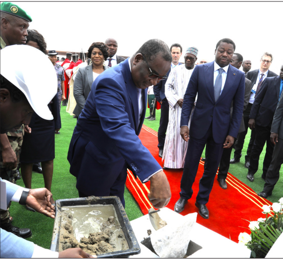
Le Premier Ministre Sélorm KLASSOU confortant le geste