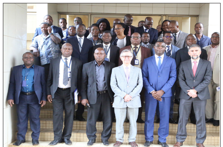
Photo de famille de l'atelier de restitution au siège de la CNSS à Lomé