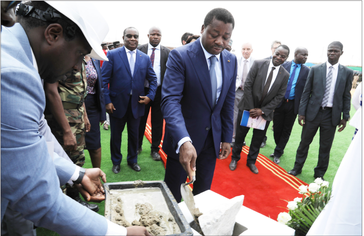
Le Chef de l'Etat Son Excellence Monsieur Faure Essozimna GNASSINGBE posant la pierre de l'Hôpital de Référence Saint Pégrin