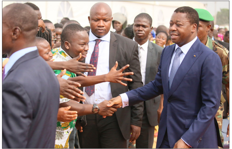
Le Chef de l'Etat saluant les populations d'Agoe