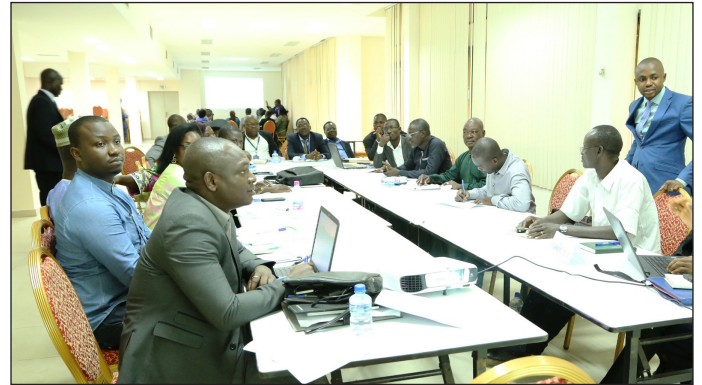
Vue partielle des travaux en atelier

de couverture sociale (Maladie, Retraite, Risques professionnels) aux acteurs de l'économie informelle. Une proposition saluée par les experts du BIT.