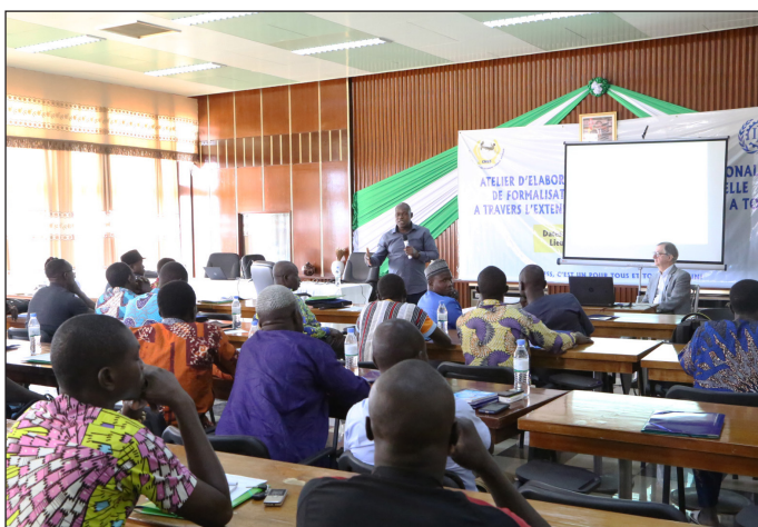
Les participants en pleine séance au palais des congrès à Kara avec les experts du BIT